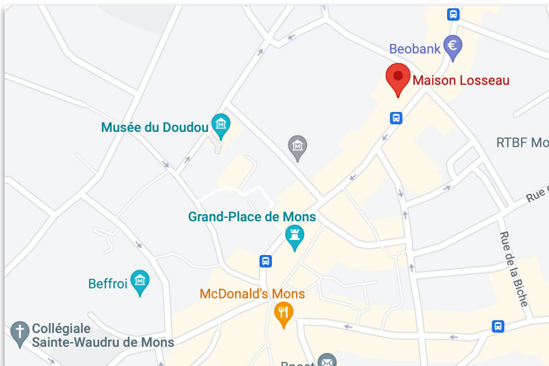
Maison Losseau - 37/39 rue de Nimy, 7000 Mons (Belgium)