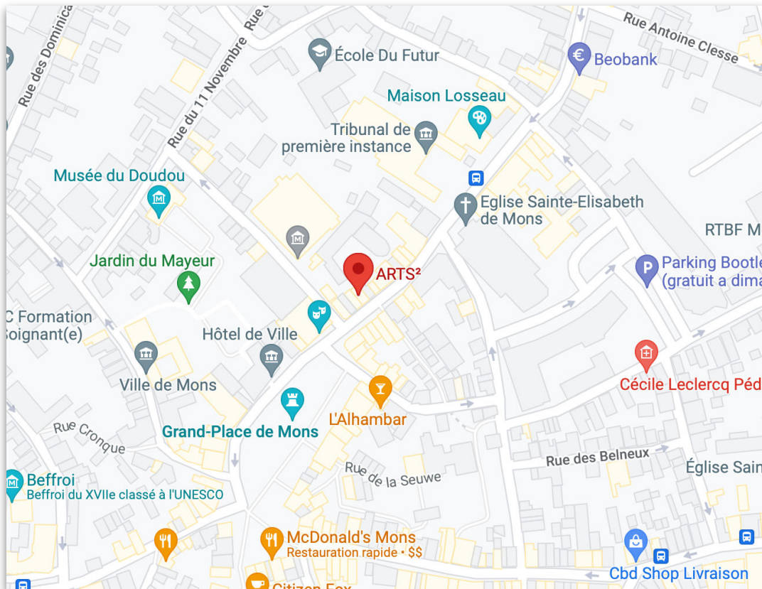
ARTS 2 - 7 rue de Nimy, 7000 Mons (Belgium)