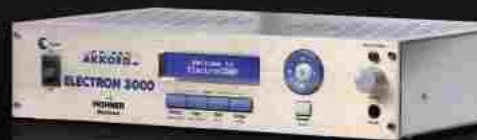
Electronium 3000 orchesterline